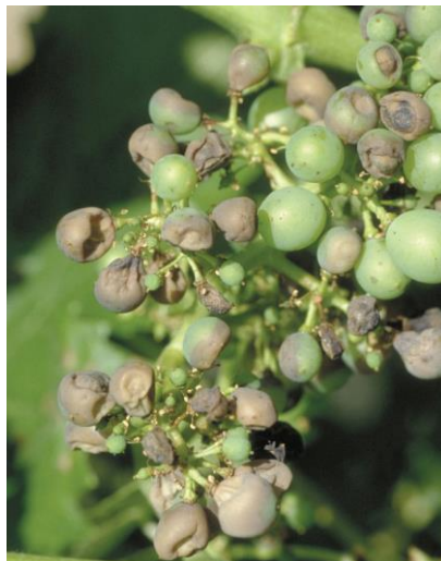
Dégâts sur grappe