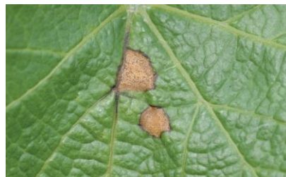
Taches sur feuilles avec pycnides

! Seule la présence de liseré et de pycnides permet d'identifier le black rot sans confusion possible.