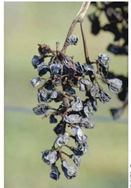
Momification des baies

! En l'absence de pycnides, il peut s'agir de rot brun (mildiou).