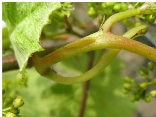
Larve Eudémis ( lobesia botrana )