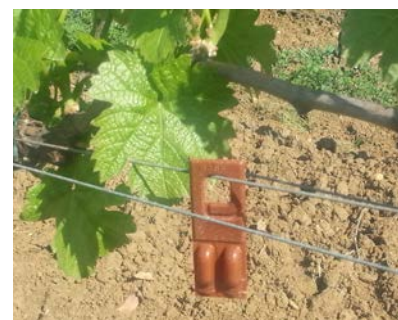
Diffuseur type « Rack » pour confusion sexuelle

Elle consiste à poser dans les parcelles des diffuseurs de phéromones qui perturbent la rencontre et limite donc l'accouplement des mâles et des femelles.