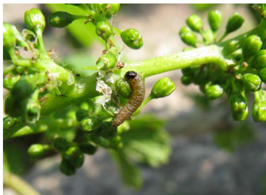
Larve Cochylis ( Eupoecilia ambiguella )

Eudémis ( lobesia botrana ) et Cochylis ( Eupoecilia ambiguella ) sont deux ravageurs importants de la vigne pouvant occasionner des pertes quantitatives mais aussi et surtout des pertes qualitatives de récolte.