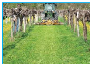
Enherbement total : allées et cavailon.