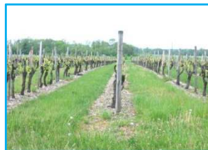
Enherbement tous les rangs.

L'enherbement consiste à maintenir et à entretenir un couvert végétal, naturel ou semé. Il peut être mis en œuvre sur la totalité des inter-rangs ou un inter-rang sur deux. Selon le contexte pédoclimatique, il peut aussi être un mode de conduite du cavailon. L'enherbement se prévoit, se choisit et se raisonne comme une culture. La décision d'enherber doit être prise suffisamment à l'avance pour préparer l'installation dans de bonnes conditions.