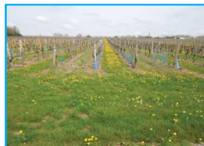
Entretien mixte : enherbement/travail du sol.